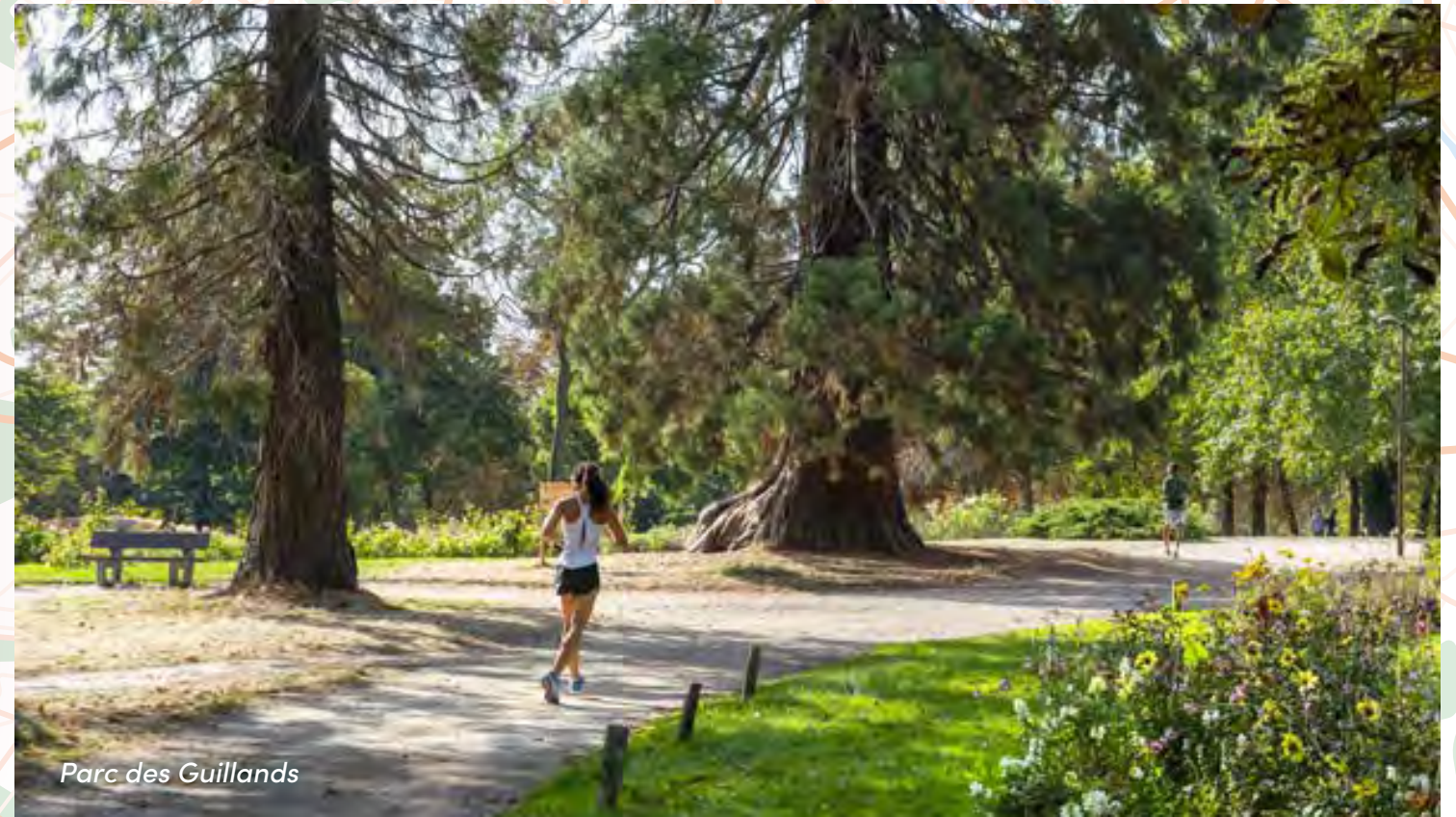
Parc des Guillands